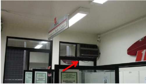
FIG. 01 - Remoção de equipamento 1 (Sinalizado com seta) – Setor de Coleta