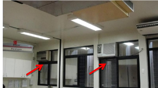
FIG.02 - Remoção de equipamentos 2 e 3 (Sinalizados com seta) – Setor de Coleta