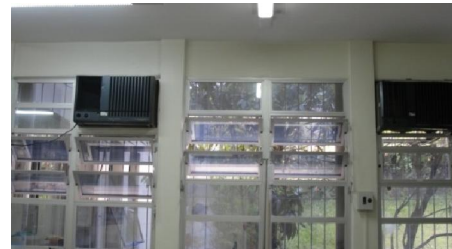
FIG 08 – Setor de Ambulatório-Transfusão, HEMOSC Coordenador