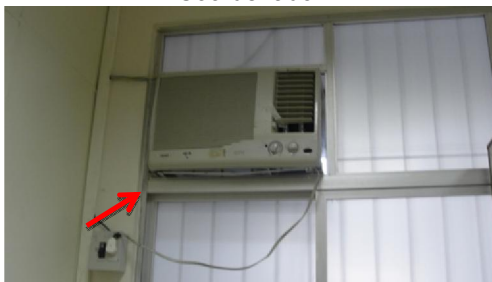
FIG. 05 - Remoção de equipamento 4 (Sinalizado com seta) – Setor de Ambulatório-Coleta de Exames