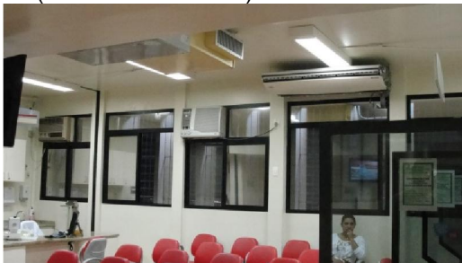
FIG 03 – Setor de Coleta, HEMOSC Coordenador