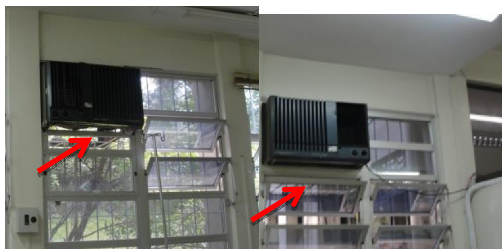
FIG. 07 - Remoção de equipamento 5 e 6 (Sinalizado com seta) – Setor de Ambulatório-Transfusão